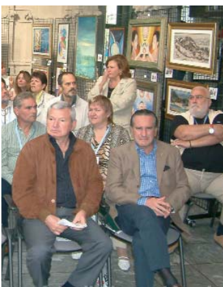
La palazzina Liberty durante la cerimonia di premiazione.