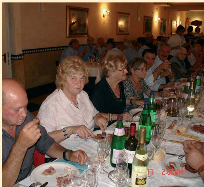
Istantanea durante il pranzo in ristorante a Ospitaletto (BS).