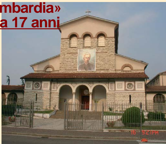
La chiesa di S. Maria Immacolata, dell'Opera Pavoniana, dove è stata celebrata la Messa per i sordi lombardi a Brescia.