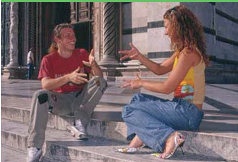
Due giovani conversano pacatamente e velocemente in lingua dei segni.

Il Governo della Spagna ha ufficializzato con apposita legge il riconoscimento della Lingua dei Segni Spagnola, che ora permette a un milione di sordi di quella nazione di comunicare tra di loro, in castigliano o in catalano segnato.