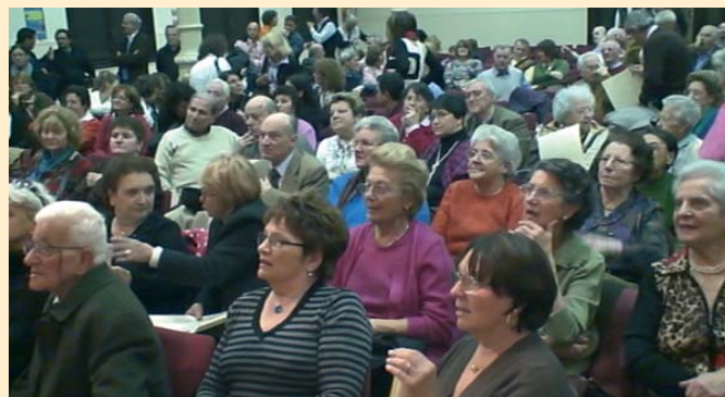
L'Aula magna sovraffollata per la festa dei sordi di Milano.