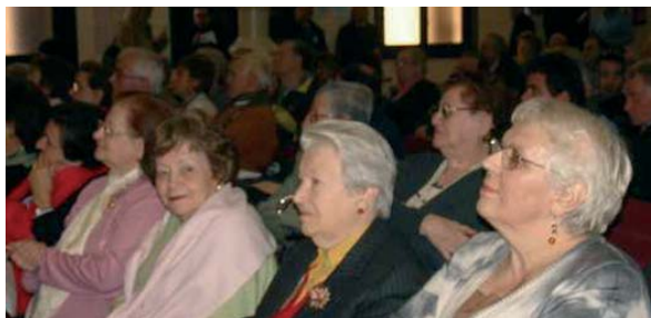
I soci seguono con attenzione i lavori dell'assemblea.