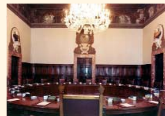
La sala del Consiglio dei Ministri a Palazzo Chigi.