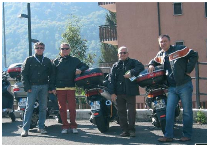
Sosta per posteggiare le moto a degustare il formaggio.