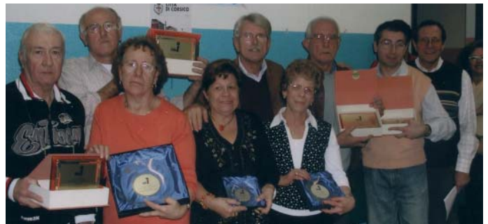
I partecipanti al 14° concorso fotografico di Corsico.