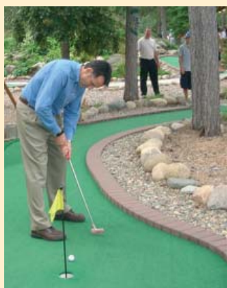
Concentrazione sulla pallina del mini-golf durante la gara.