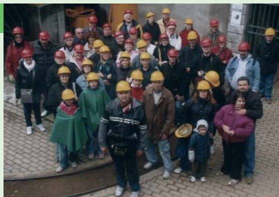
Visita alla miniera di talco (con elmetto obbligatorio),