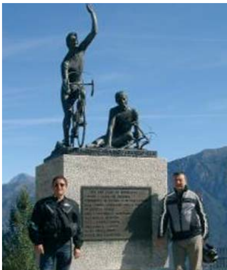
Ciclisti di ieri (in alto) e centauri di oggi (sotto).

Nella prima settimana di settembre il Gruppo Motociclisti ENS di Milano ha effettuato un giro turistico in moto. Ci si è fermati a Barni per la colazione. Ripreso il viaggio, abbiamo poi raggiunto Magreglio, per visitare il Santuario della Madonna del Ghisallo, famosa per la storia di noti ciclisti lì rappresentati con tante biciclette e magliette di Ganna, Galetti, Gerbi, Bottecchia, Girardengo, Belloni, Rossignoli, Brunero, Binda, Guerra, Bartali, Coppi, Magni e altri. Vicino al Santuario si trova il museo del ciclismo, che abbiamo pure visitato. Il viaggio in moto è poi ripreso e ci siamo fermati a Bellagio (Lago di Como), un bel paese con tanti cunicoli e porticcioli dove abbiamo consumato il pranzo al «Caffè Vecchio Borgo», quindi abbiamo visitato il paese. Abbiamo poi deciso di prendere il traghetto che, con fermate a Cadenabbia, Porlezza e Lugano, ci ha portati a Campione d'Italia, dove c'è il famoso Casinò. Quindi, contenti e soddisfatti della gita, abbiamo ripreso le moto per il viaggio di ritorno a Milano.