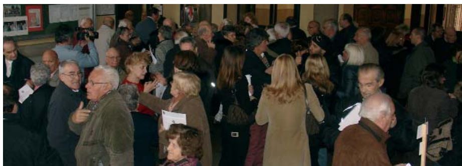
L'ingresso dell'auditorium di soci dell'Ente Nazionale Sordi di Milano e Provincia.

Per questo concludo con l'augurio che il nuovo Consiglio Provinciale che oggi verrà eletto prosegua su questa strada con la stessa passione che finora ha contraddistinto l'operato di ENS nel valorizzare le straordinarie potenzialità di cui sono dotate le persone non udenti, ma soprattutto nell'essere vicini alle loro esperienze di vita, che hanno molto da dire e tanto da dare.