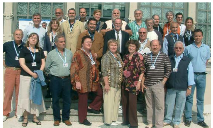
Foto di gruppo dei pittori partecipanti alla mostra-concorso alla Palazzina Liberty, in occasione della presentazione del libro.