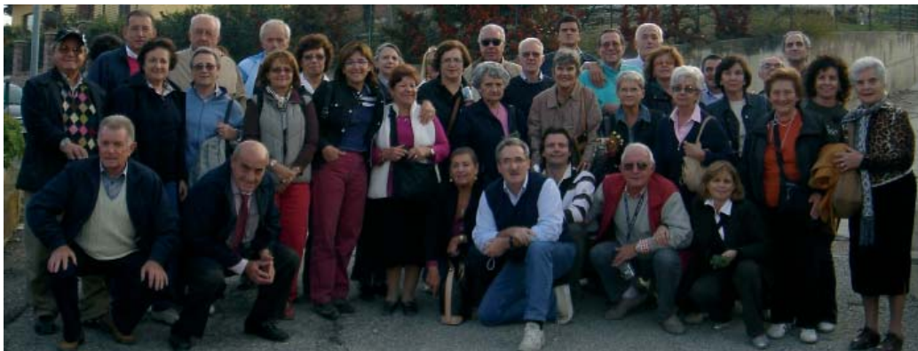
Il folto gruppo di soci partecipanti alla gita nelle Langhe.