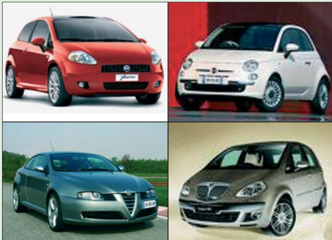
Nuova agevolazione per l'acquisto di un'auto.