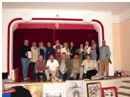
Ritratto degli Artisti 2008