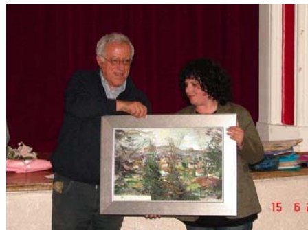
2° Premio del Concorso 2008