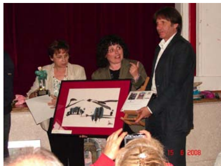
1° Premio del Concorso 2008