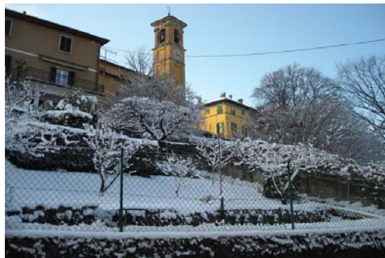
Alla Chiesa di Cuvio in inverno