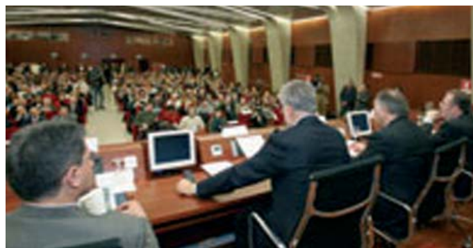
Una veduta della sala «Gaber» durante l'assemblea regionale della FAND.

(1) Proprietà specifica (nel caso: che appartiene alla categoria.