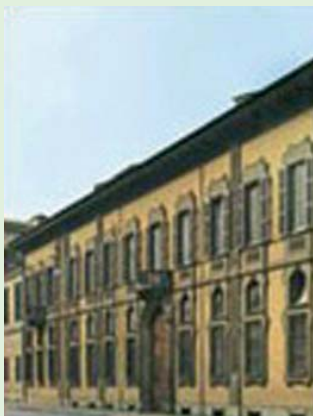
Palazzo Isimbardi Sede della Provincia di Milano.

al Parlamento italiano di procedere urgentemente all'unificazione dei diversi progetti di legge in materia