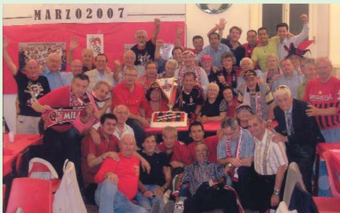
I sordi milanesi tifosi del Milan immortalati alla «loro festa», in spregio a quella precedente dei tifosi interisti.