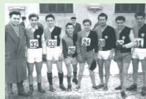
La squadra di atletica leggera della «Silenziosa» negli anni 50.