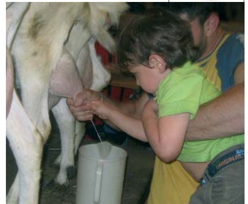
Un bambino osserva con attenzione la mungitura.

Il momento più bello è stato sicuramente quando tutti i bambini e anche molti adulti, si sono cimentati con le mam-