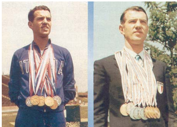
Giovanni Calissano carico di medaglie nelle foto dei Giochi 1965 (Washington) e 1969 (Belgrado).

Tra i 10 atleti sordi che hanno conquistato più medaglie ai Deaflympic (ex World Games), figura al primo posto il tiratore italiano Giovanni Calissano , con ben 19 medaglie d'oro, 14 d'argento e 5 di bronzo conquistate in 8 edizioni dei Giochi quadriennali a cui ha partecipato, mentre tra i 10 atleti sordi che meglio si sono distinti anche alle Olimpiadi "normali", è evidenziato ancora un italiano, il lottatore Ignazio Fabra , con due medaglie d'argento conquistate nel 1952 Helsinki e poi ancora nel 1956 (Melbourne), mentre alle Olimpiadi del 1960 (Roma) e del 1964 (Tokio) pur non essendo salito sul podio, aveva ottenuto posizioni di tutto rispetto (5° e poi 4° posto). Il libro contiene quindi le statistiche, con l'elenco dei 33 Giochi disputati, 19 edizioni di quelli Estivi 14 di quelli Invernali , di cui tre si sono disputati in Italia, quelli Estivi di Milano 1957 e Roma 2001 e i Giochi