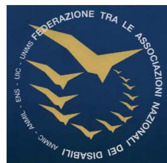
Il logo delle FAND