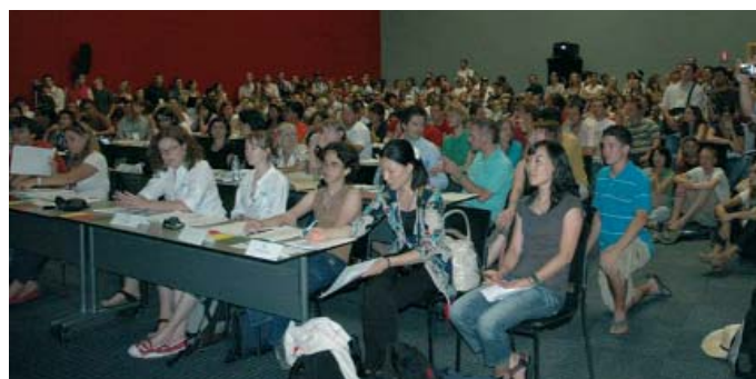
Una Commissione al lavoro durante il Congresso di Madrid.

Il 15° Congresso è stato interamente dedicato alla Lingua dei Segni, per il cui rico-