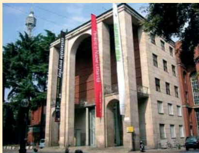
Palazzo della Triennale al parco Sempione

Il convegno su « European Institute of Design for disable », tenutosi alla Triennale di Milano il 28 e il 29 giugno 2007, ha trattato il tema del turismo sotto diversi aspetti. Partendo dal presupposto che l'accessibilit  al turismo non pu  prescindere dalla cultura dell'accessibilit , affrontando l'argomento dal punto di vista legislativo, sociale, ecologico, economico e geografico, con particolare attenzione a chi offre il servizio e chi ne fruitore.