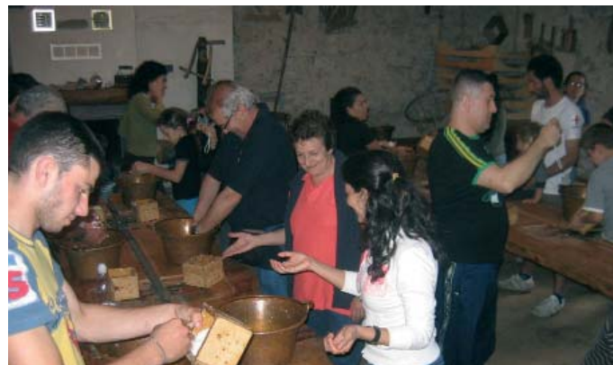
Una fase della «didattica del formaggio», impartita ai soci ENS che hanno visitato dell'agriturismo «Ferdy», a Lenna.