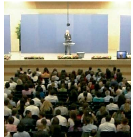
Una veduta della sala di Imola (BO) durante l'Assemblea dei Testimoni di Geova.

Circa 800 persone, Testimoni di Geova e non, sordi e udenti, provenienti dal Nord e Centro Italia hanno gremito per tre giorni, dal 10 al 12 agosto, la Sala delle Assemblee di Imola e si sono concentrati su quello che i Testimoni credono sia un aspetto fondamentale della vita: imitare Gesù Cristo sotto tutti i punti di vista. Molti dei presenti che non erano