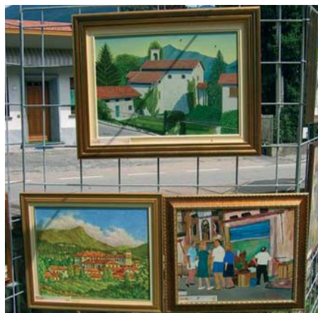
Alcuni dei quadri degli artisti sordi partecipanti ed esposti alla mostra.