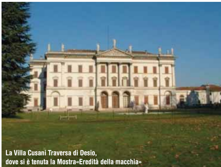
La Villa Cusani Traversa di Desio, dove si è tenuta la Mostra «Eredità della macchia»