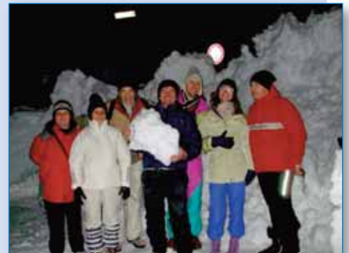
Il gruppo di sordi avventurosi prima della partenza al chiaro di luna

Si tratta di uno dei più bei percorsi di escursionismo invernale con le ciaspole di tutta la Lombardia, se è bello di giorno, figuratevi di