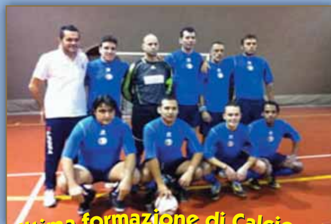
Ultima formazione di Calcio a 5