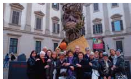
Il gruppo di sordi che ha visitato la mostra di Arcimboldo

Il gruppo di appassionati d'arte del CCRENS non si è lasciato sfuggire una straordinaria possibilità: quella di vedere dal vivo le opere dell'artista milanese Giuseppe Arcimboldo, in mostra a Palazzo Reale, famoso per le sue bizzarre "Teste Composte".