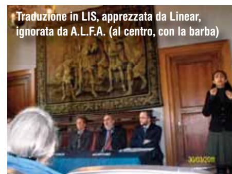
Traduzione in LIS, apprezzata da Linear, ignorata da A.L.F.A. (al centro, con la barba)