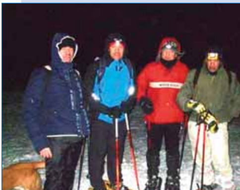
Non si distinguono, ma sono sordi, attrezzati per il trekking nella neve e sotto la luna

notte! Noi ci abbiamo provato, alcuni muniti di torce, altri fidando nella luna piena. Il percorso al chiaro di luna e sopra la neve, nella brezza gelata della notte di marzo è stata un'esperienza indimenticabile.