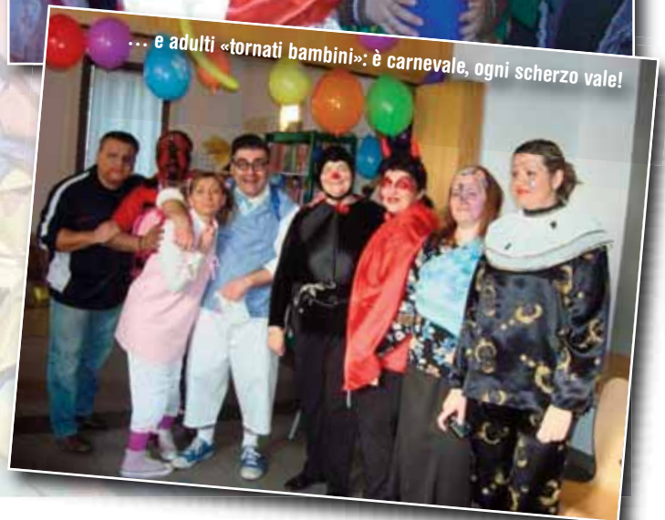
... e adulti «tornati bambini»: è carnevale, ogni scherzo vale!