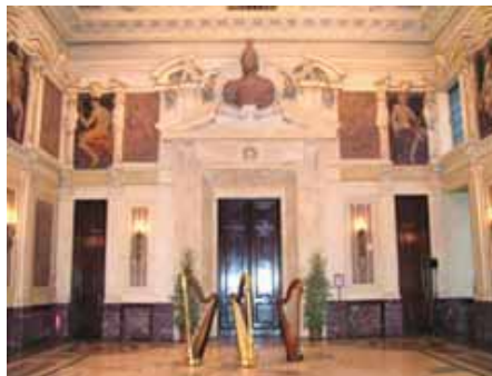
Interno della "Sala Alessi" a Palazzo Marino

La visita, durata tre ore, si è conclusa con una rapida visione degli uffici amministrativi, simbolo e orgoglio dell'efficienza politica milanese.