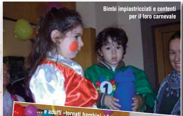
Bimbi impiasticciati e contenti per il loro carnevale