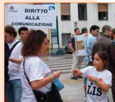
«Anch'io voglio la LIS subito! Capito?!». Perché contrariarla?