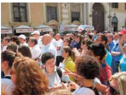
A Montecitorio per chiedere la Legge sulla LIS