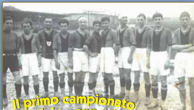
Il primo campionato di calcio - anno 1932