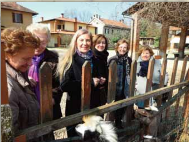
Curiosità e molto interesse al recinto degli animali