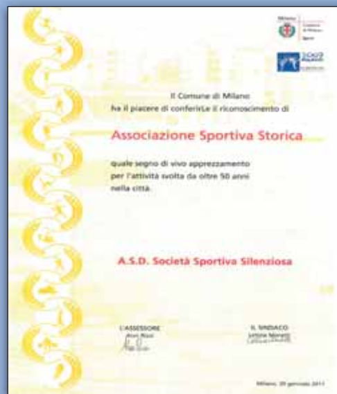
Attestato di Associazione Storica conferito dal Comune di Milano il 20 gennaio 2011

Il 10 maggio 1925 si è costituita in Milano la Società Sportiva Silenziosa (S.S.S.) con lo scopo di diffondere fra i sordomuti di Milano e Provincia le sane discipline dell'educazione fisico-morale e dei giochi sportivi.