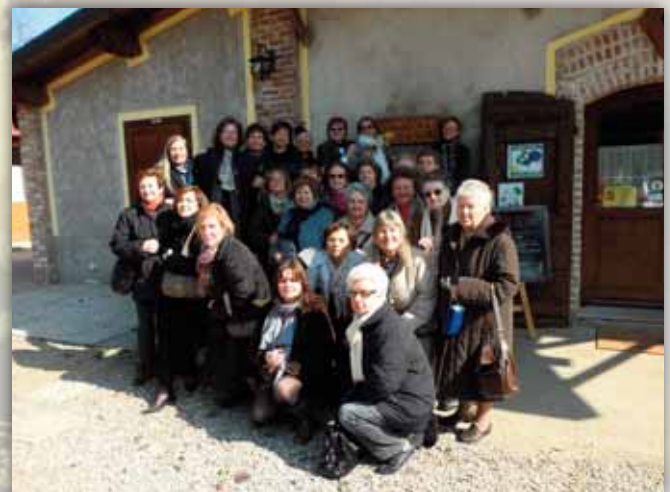
Il gruppo delle donne che hanno celebrato la loro festa alla Cascina Selva di Ozzero