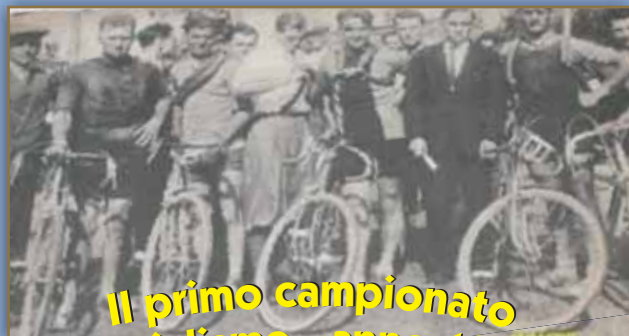
Il primo campionato di ciclismo - anno 1929