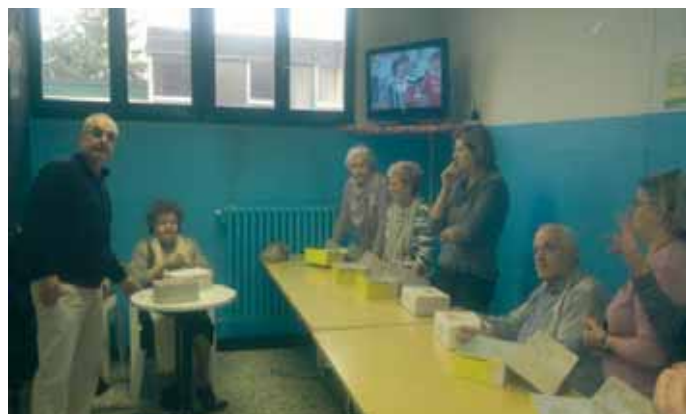
Una fase del gioco a premi