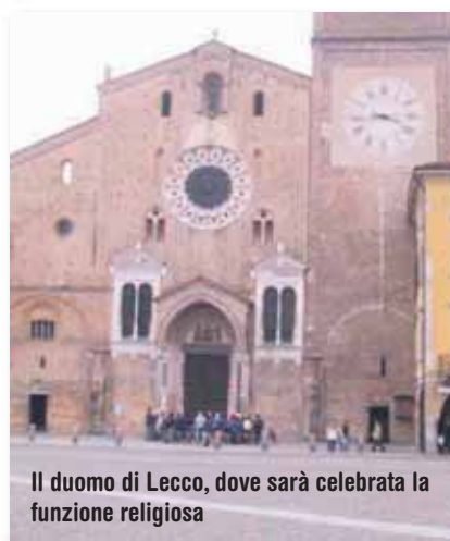
Il duomo di Lecco, dove sarà celebrata la funzione religiosa

Il programma, sarà cura della Sezione ENS esporlo in bacheca e pubblicarlo sul sito www.ensmilano.it appena ne verremo in possesso. E' confermato che la sezione milanese predisporrà un servizio A-R in pulman.