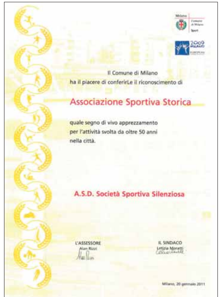
Attestato per la Società Sportiva Silenziosa