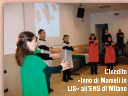
L'inedito «Inno di Mameli in LIS» all'ENS di Milano